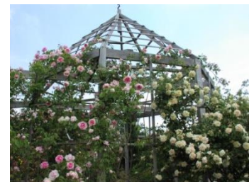
Photo: Gloriette à la Roseraie du Désert avec Rosa 'Marie Robert' et Rosa 'Parks Yellow Tea'

paysagistes (Jean Mus & Compagnie et Jardinerie Nova) et pépiniéristes (Pépinières Pellizzaro et La Roseraie du Désert).