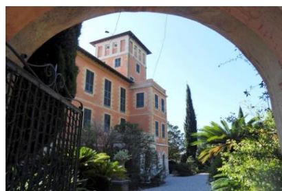
Photo: Palazzo Orengo, Giardini Botanici Hanbury

Les Giardini Botanici Hanbury , près de Vintimille