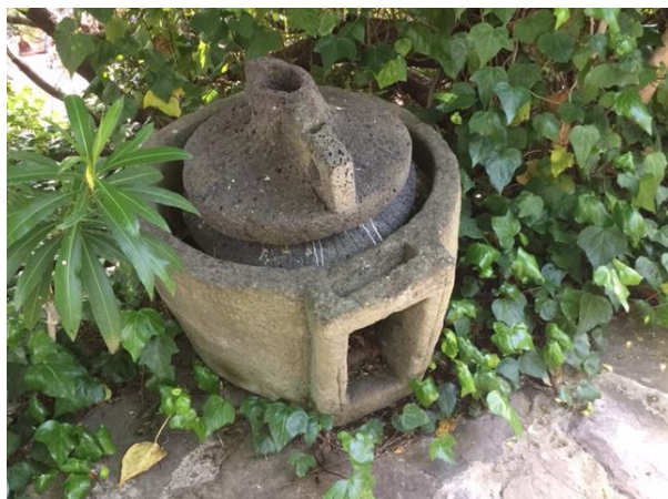
Photo: Moulin à farine.