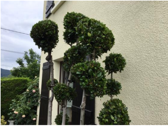
Laurus nobilis taillé en nuage après deux ans.