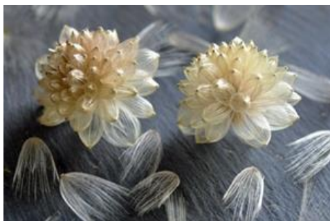
Photo: Myrsine africana