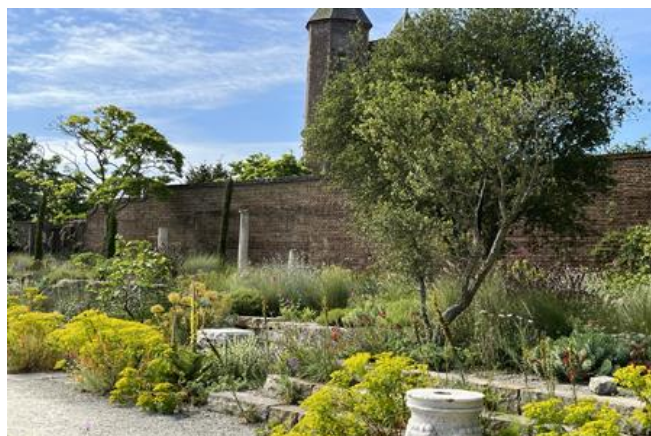
Le Delos garden