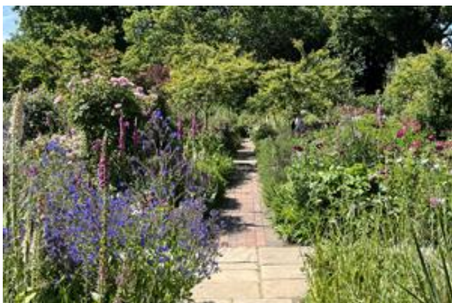
Jardin du château de Sissinghurst