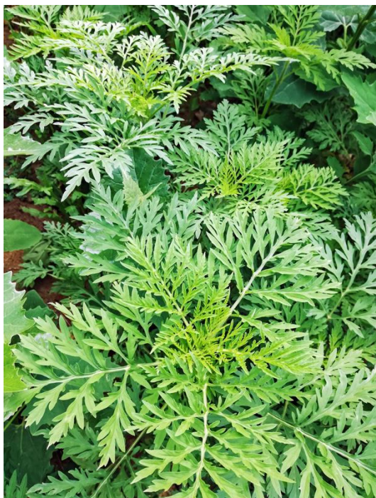
Ambrosia artemesifolia