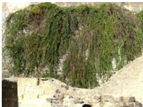
Capparis spinosa (Herculanum, Italie)