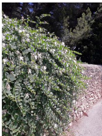
Capparis spinosa (Loupian, Hérault, France)