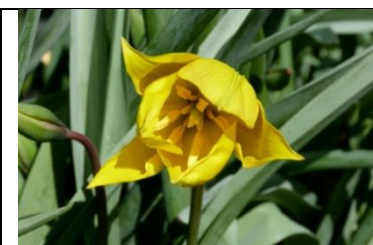
Photo: Tulipa sylvestris

Un compte-rendu de la visite du jardin de démonstration Bulb'Argence en mars.