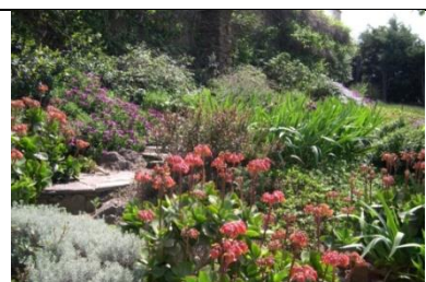
Photo: Cotyledon macranthus