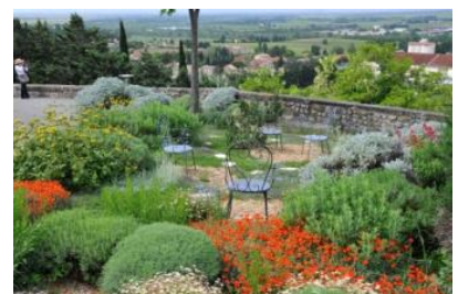
Photo: Jardin 'Horizon vertical' - Cairanne