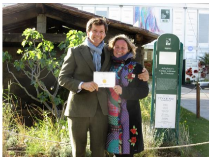
Photo: James et Helen avec leur médaille d'or obtenue au Chelsea Flower Show

Les activités commenceront par un déjeuner au Restaurant Guy Molas, suivi de l' Assemblée Générale annuelle MGF .