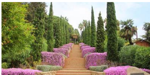
Photo: Drosanthemum floribundum en fleurs à Marimurtra.