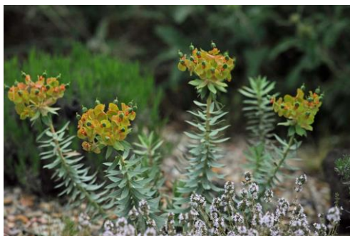
Photo : Euphorbia rigida à la mi-avril