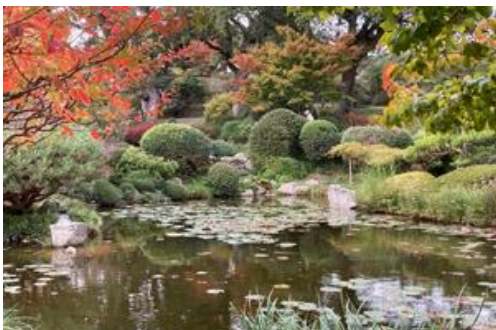
Photo: Le groupe MGF à l'entrée du jardin zen