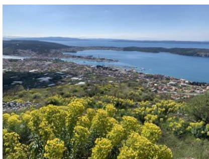
Photo: Euphorbia characias au-dessus de Trogir