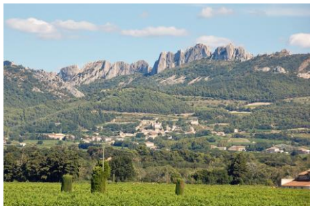
Photo : Dentelles de Montmirail