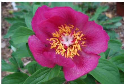
Photo : Paeonia officinalis