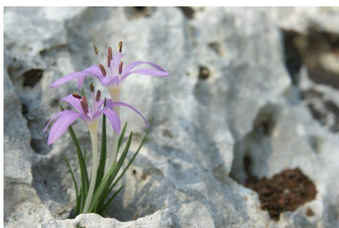
Photo: Colchicum stevenii

Organisé par Mediterranean Plants and Gardens