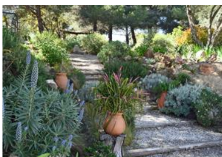
Photo: Le jardin du Château de la Moutte